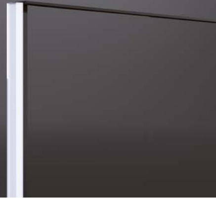
Neues, selbstklebendes Dichtprofil